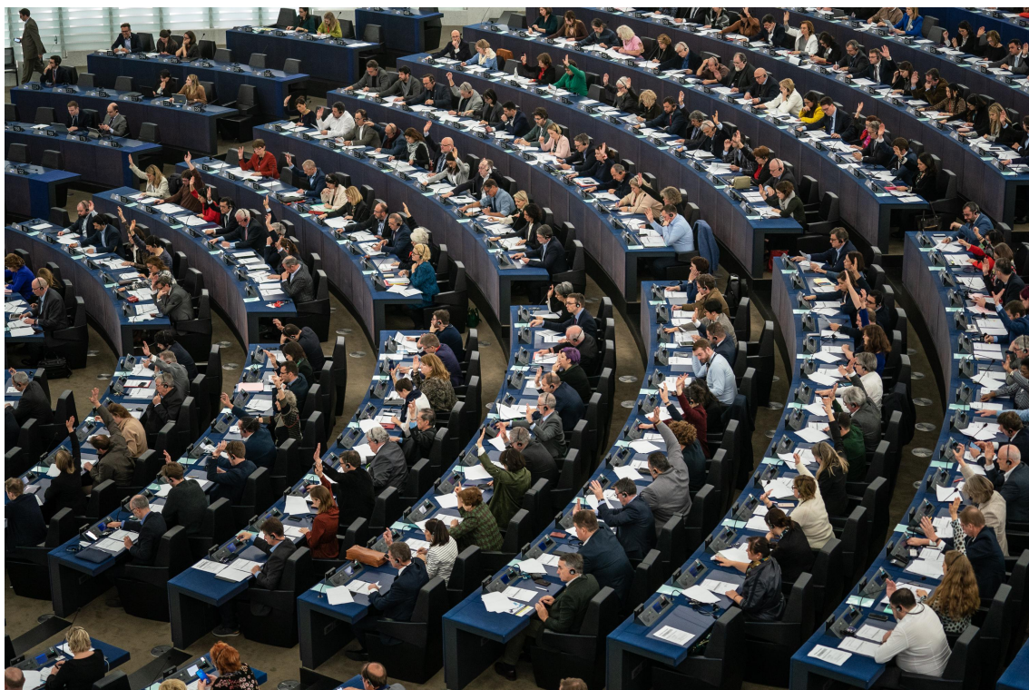
Visual for Press Kit