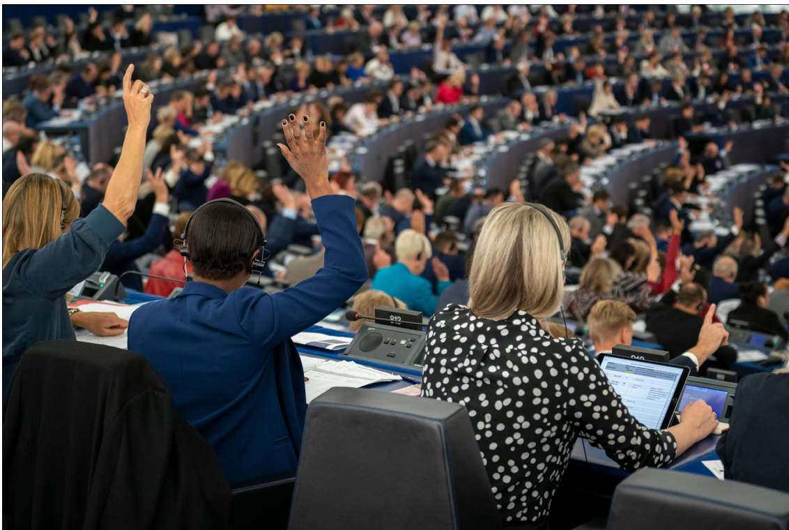
Европейският парламент по време на гласуване в пленарна зала

Съдържанието на този медиен пакет ще бъде редовно актуализирано с приближаването на 10-те европейски избори, които ще се проведат във всички държави членки на ЕС, от 6 до 9 юни 2024 г.